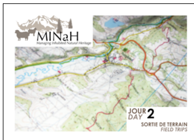
En cliquant sur l'image, découvrez les récits et photographies des trois circuits Click on the icon for the descriptions and photographs of the three circuits

Field trips to meet up and discuss with local players were organised for the middle day of the conference to provide a practical illustration of the themes under discussion. The destinations covered the natural landscape of the Chaîne des Puys, the Limagne Fault, the Sancy and the Livradois-Forez. During the course of these circuits a number of specialists shared their experience of the best ways to manage these natural inhabited sites. This included insight into the management methods which have been set up in the region to conciliate the different land usages, as well as the measures and alterations carried out to achieve the activities which have developed there (tourism, habitat, economic activities, conservation and enhancement of the landscape).